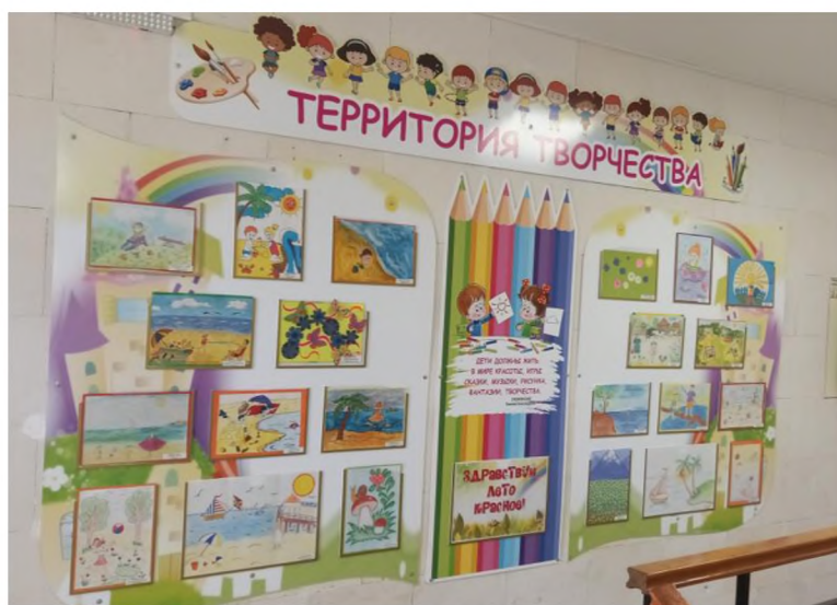
Выставка детских рисунков